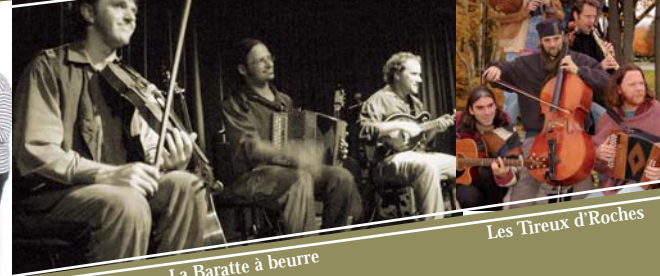
La Baratte à beurre

Sept musiciens donnent vie à une musique colorée et irrésistiblement entraînant. La fraîcheur et l'originalité de leur musique tiennent autant aux sources d'un riche répertoire traditionnel (Irlande, Angleterre, Nouvelle-Écosse, Québec) qu'à la finesse des compositions aux accents plus actuels, ainsi qu'au mélange d'instruments traditionnels et modernes qu'ils emploient.